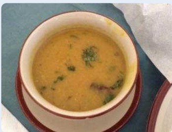
カレーのご飯にはダルという お豆のスープをかけるのが基本。

ネパールの首都カトマンズは標高1300 ㍎くらいです。10月末でも暖かく、滅多に雪は降らないそうです。カトマンズには5つ星のホテルも5か所あって、カジノも併設されています。ホテルはいいんですが、街に出るとインフラ整備がイマイチで、道路やトイレはちょっと困りものでした。ネパールはインドの北部に位置するのでインド系的人也多く、カレー料理がメインです。普通はやっぱり右手で食べるのだそうですが、我々旅行者には必ずナイフ&フォークが出ますのでご心配なく。物価は安く、100円あったら大抵のものは手に入る感じです。カトマンズは都会なので、中華料理、イタリアン、コーヒーショップなどなかなかのものでした。人間性もとてもよく、レストランのスタッフはいつも笑顔で迎えてくれます。ネパールは農業人口が90%以上の超農業国。そしてヒマラヤを北に頂く素晴らしい自然あふれる国です。ちょっと遠いですが参考になりましたか？