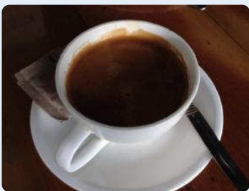
コーヒーはちょっと濃いめですが、 普通に美味しいです。