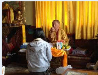
ボータナート寺院で 高僧チェキ・ニマ大師の説法を聴く