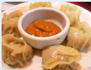
これはモモというどんなレストラン にもある食べ物。餃子でした。