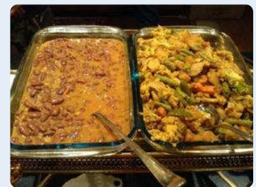
こんな感じでいろんな種類の カレーのルーが準備されています。