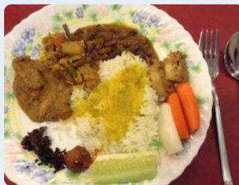
カレーは自分の好きなルーを 好きなだけ盛り付けます