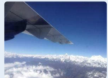
ブッダ航空のプロペラ機で ヒマラヤの山並みに接近

ネパールの首都カトマンズは標高1300 ㍎くらいです。10月末でも暖かく、滅多に雪は降らないそうです。カトマンズには5つ星のホテルも5か所あって、カジノも併設されています。ホテルはいいんですが、街に出るとインフラ整備がイマイチで、道路やトイレはちょっと困りものでした。ネパールはインドの北部に位置するのでインド系的人也多く、カレー料理がメインです。普通はやっぱり右手で食べるのだそうですが、我々旅行者には必ずナイフ&フォークが出ますのでご心配なく。物価は安く、100円あったら大抵のものは手に入る感じです。カトマンズは都会なので、中華料理、イタリアン、コーヒーショップなどなかなかのものでした。人間性もとてもよく、レストランのスタッフはいつも笑顔で迎えてくれます。ネパールは農業人口が90%以上の超農業国。そしてヒマラヤを北に頂く素晴らしい自然あふれる国です。ちょっと遠いですが参考になりましたか？