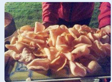
これは揚げせんべい。 シャキシャキで美味。日本と同じですね。